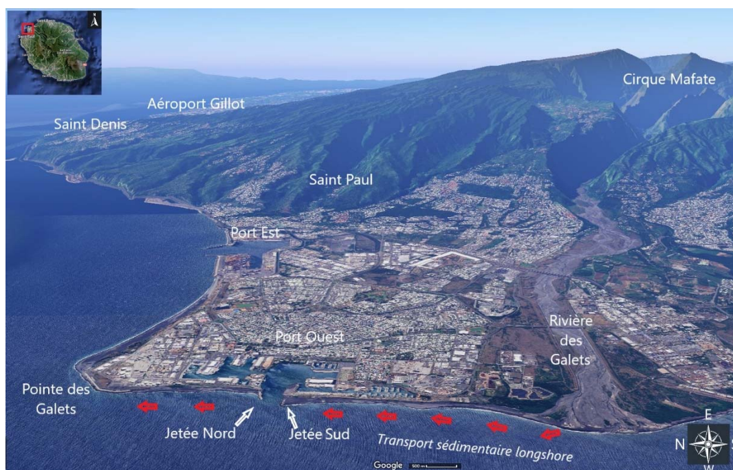
Figure 1. Plan de situation – Port Ouest (Ile de la Réunion) – Image Google 3D.

La morphologie sous-marine est particulièrement accore. Les pentes conduisant à la profondeur - 50 m sont souvent supérieures à 20 % et croissent avec la profondeur pour atteindre une situation proche du profil d'équilibre des matériaux non cohésifs. Les fortes houles (ASCIONE & GAUFRÈS, 2006) déclenchent l'effondrement d'accumulations sédimentaires ; des coulées gravitaires s'observent en grande profondeur.