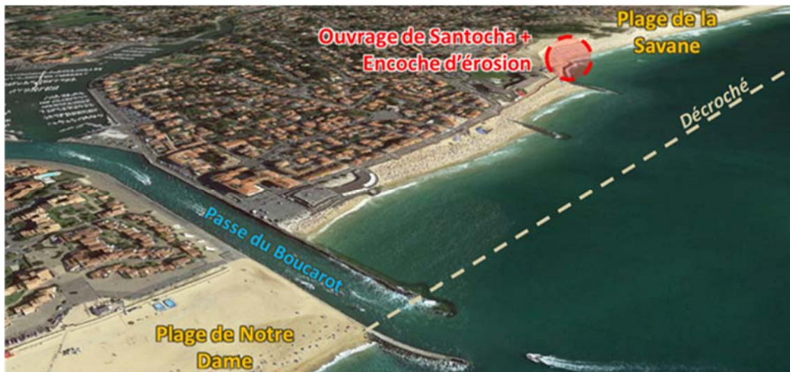
Figure 1. Description du site de Capbreton.

Les problématiques d'érosion, de protection côtière et de mouvements de sables spécifiques à la ville de Capbreton sont bien connues dans la profession ainsi que par les habitants et usagers. En effet, la présence du gouf et des jetées de la passe du Boucarot coupe le transit littoral Aquitain venant du Nord engendrant un déficit de sable plus au Sud. Ce déficit, se traduit par un décroché dans le trait de côte d'environ 450 m entre la plage Notre-Dame et la plage de la Savane. Ce décroché, au Sud du débouché, est accompagné par des ouvrages de protection longitudinaux et transversaux. A l'extrémité Sud de ces ouvrages une encoche d'érosion est observée, comme illustré sur la figure 1.