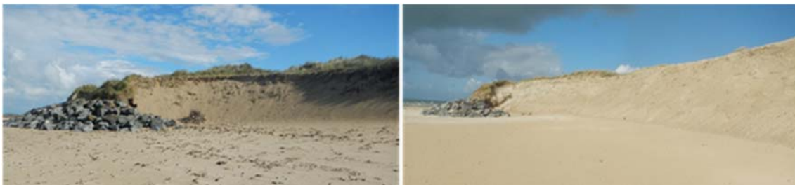
Figure 6. Recul de la dune à l'extrémité Sud du perré – Vue avant rechargement après rechargement.

Aujourd'hui, à l'image de la digue de Cleut-Rouz (Fouesnant, 29), se pose la question de réaliser un musoir suffisamment ancré en partie avant et arrière permettant de stabiliser l'ouvrage, même en cas de mouvements de sable et de contournement par l'érosion.