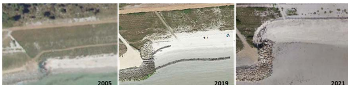
Figure 5. Effet de bout au niveau de la terminaison Est de l'enrochement.

Pour faire face à ce phénomène, un retour en enrochements de 20 m a été réalisé, entre 2010 et 2012, afin de se prémunir d'un éventuel contournement de l'ouvrage (voir figure 5). Toutefois, le point de diffraction de la houle, initialement positionné dans la continuité des enrochements, s'est donc décalé dans les terres. Cela a eu pour conséquence d'augmenter l'emprise de l'encoche d'érosion. Alors que l'érosion au niveau de l'encoche perdure, des pieux bois sont battus sur deux axes longitudinaux, en continuité de l'ouvrage en 2015.