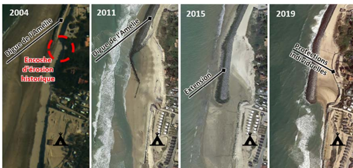
Figure 2. Effet de bout au niveau de la terminaison Sud de l'enrochement.

La nouvelle configuration de l'ouvrage, qui peut s'apparenter dans sa partie Sud à un brise-lame, a permis de stabiliser l'encoche historique. Toutefois, des phénomènes hydrodynamiques de mise en charge et de chasse sont apparus en arrière de l'ouvrage et ont nécessité la mise en œuvre de protections individuelles. Dans la même zone, le camping a mis en place une protection qui a généré une nouvelle encoche plus au Sud.