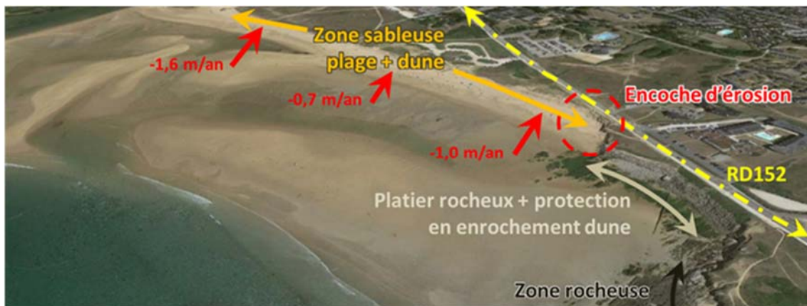
Figure 3. Description de la plage de la falaise.

L'analyse de l'évolution du trait de côte dans le temps, réalisée sur les dates 1989, 2004, 2011, 2014, 2018 et 2020, permet d'obtenir un taux de recul sur la plage compris entre -0,7 et -1,6 m/an. Les taux étant plus forts au niveau des extrémités Nord (flèche sableuse) et Sud (transition avec la roche).