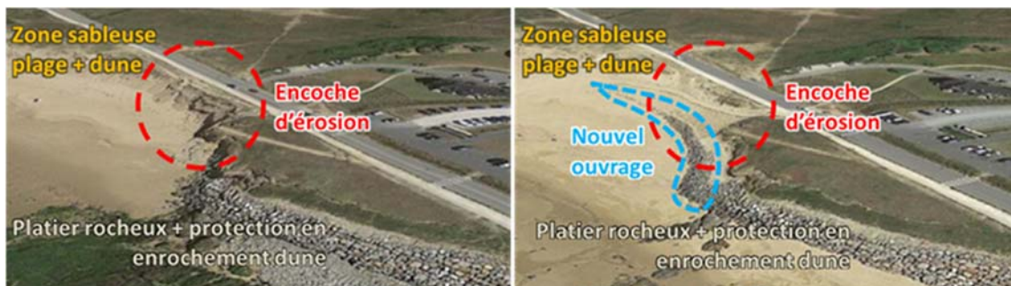
Figure 4. Encoche d'érosion avant et après réalisation de l'ouvrage.