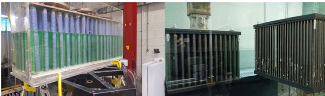
Figure 2. Illustration des expérimentations en hexapode et en canal.

face à différentes configurations de houles : 2 types de tests en modèles physiques (figure 2), i.e. en hexapode et en canal à houles, et des tests en modèles numériques.