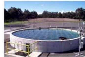
A 50 m 2 solar pond at RMIT University