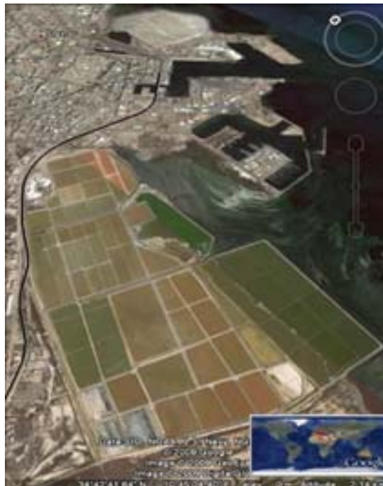
Illustration 2. Sfax-Thyna en Tunisie : Un exemple méditerranéen de complémentarité potentielle « marais salants et bassins solaire/ville-port-territoire ».

Sur ces bases un partenariat euro-méditerranéen important a été mis en place avec la Région autonome de Sardaigne qui se propose comme chef de file associé à MALTAE initiateur et Chef de projet pour apporter des réponses à cette problématique dans le cadre de l'appel à propositions du programme européen IEV CBC MED 2014-2020 lancé à l'Eté 2017, et pour lequel, entre autres pays éligibles ou associés comme la Croatie), la Tunisie, l'Egypte, la Grèce, l'Espagne, ...devraient être largement parties prenantes, pour une durée de 3 ans, au côté de l'Italie et de la France, pour mener ce projet (Acronyme RESILIENT).