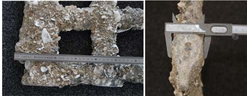
Figure 2. Exemple d'un morceau de Geocorail de 14 mois formé sur un treillis soudé 15×15×0.7 cm sur le Chantier Pilote à Châtelailon-Plage (17).

Il est important de rappeler que la cinétique de croissance et les caractéristiques mécaniques du Geocorail sont entièrement dépendantes des facteurs environnementaux (granulométrie du site, température de l'eau, conditions hydrodynamiques...) et des valeurs de courant injectés (cœur du process de Geocorail SAS).