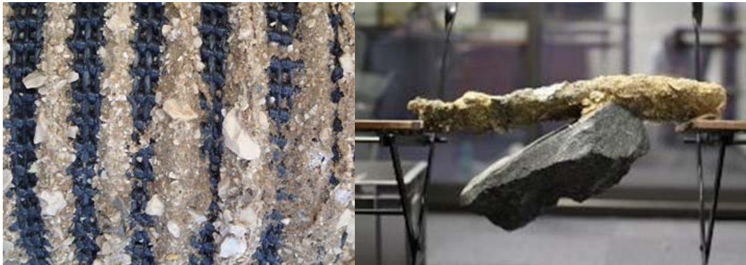
Figure 5. Exemples d'application du Geocorail : renforcement de geotextile (image de gauche) et prise en masse rocher (Durite, 8kg)- Geocorail (image de droite).