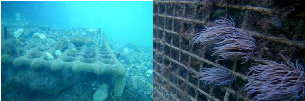
Figure 6. Tapis anti-affouillement Geocorail installé en pied de quai, Le Pradet, 2017.