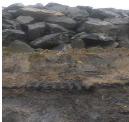
Figure 4. Application pour un support d'encrochement.