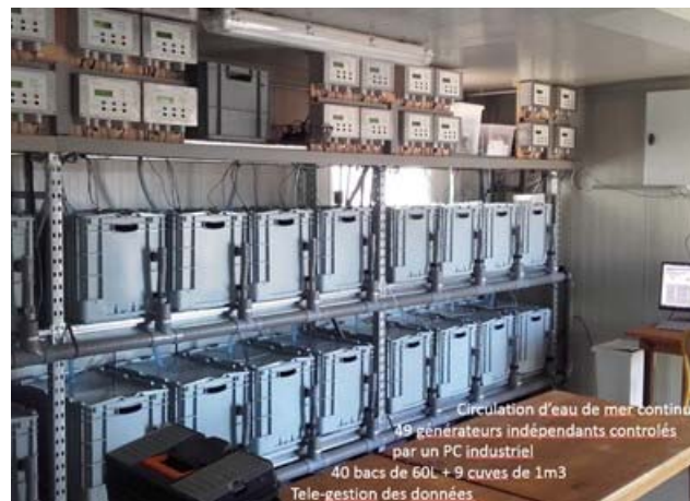
Figure 3. Laboratoire R&D de Fos-sur-Mer.

Afin d'optimiser la croissance et la solidité du matériau, un laboratoire de R&D comprenant 40 bacs autonomes a été mis en place depuis septembre 2016 à Fos sur Mer pour comprendre et appréhender le plus finement possible l'influence des différents paramètres (figure 3).